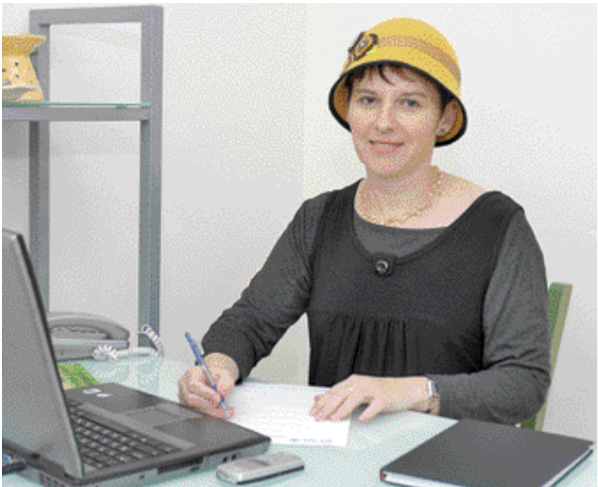
המשך מהעמוד הקודם

שלי. בתקופה זו הייתי שותפה בקידום מהלכים שונים למניעת תאונות דרכים, כולל ייזום קמפיינים בכנסת, קידום חקיקה ופרויקטים ארציים שונים. סללתי את הדרך למספר פרויקטים שרצים כיום בלעדי. לאחר שהרגשתי שלא נכון לי יותר לעסוק בתחום - חזרתי למסלול הקריירה שלי תוך שלמות מיצוי, סיפוק וידיעה שעשיתי מה שיכולתי."